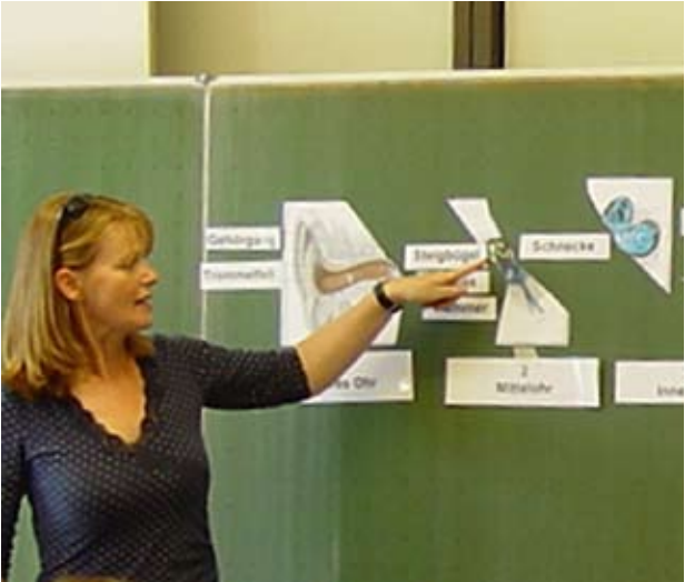
Kooperationslehrerin beim Unterricht in einer beruflichen Schule zum Thema „Hören und Auswirkungen von Hörschädigungen“.

Die Kooperationslehrer/-innen im Sonderpädagogischen Dienst begleiten und unterstützen die Jugendlichen in Fragen ihrer schulischen Ausbildung. Jugendliche, Berufsschulen und Eltern können die Kooperationslehrer/-innen direkt beauftragen.